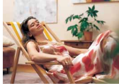
Ein Klima, das zum Ausspannen einlädt

Optimales Raumklima: Raumlufthtemperatur 18°–22° Oberflächentemperatur 20°–23° relative Luftfeuchte 40%–60%